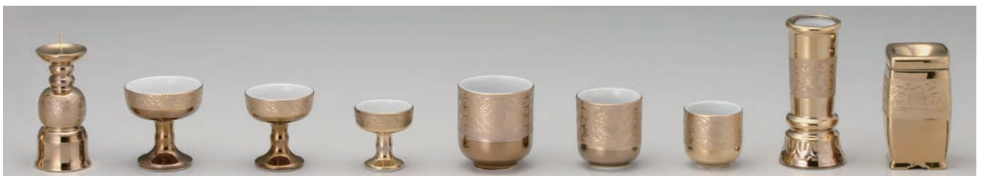
No.700-013 No.700-014 No.700-015 No.700-016 No.700-017 No.700-018 No.700-019 No.700-020 No.700-021 金唐草 3.0 ロウソク立 4.3 × H9.0cm 金唐草大仏器 5.8 × H6.3cm 金唐草中仏器 5.2 × H5.7cm 金唐草小仏器 4.5 × H4.8cm 金唐草 1.8 湯呑 5.8 × H6.5cm 金唐草 1.6 湯呑 5.0 × H5.5cm 金唐草ノゾキ 4.5 × H4.5cm 金唐草線香差 5.0 × H11.0cm 金唐草マッチ消し 5.2 × 5.2 × H8.7cm