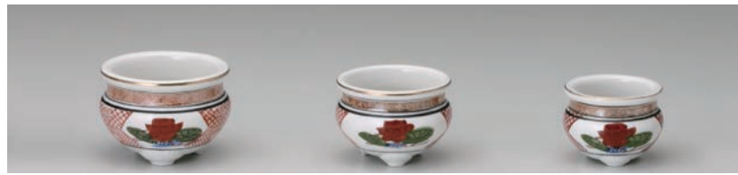
No.700-091 錦 4.0 香炉 11.5 × H8.0cm