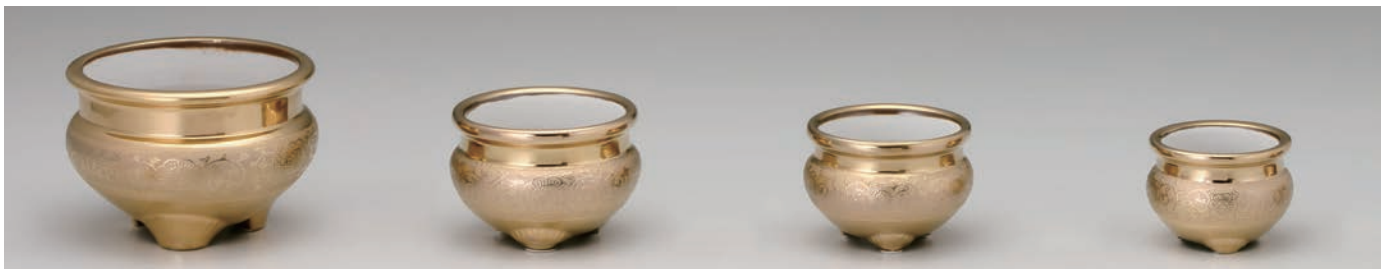
No.700-007 No.700-008 No.700-009 No.700-010 金唐草 5.0 香炉 15.3 × H10.8cm 金唐草 4.0 香炉 11.5 × H8.0cm 金唐草 3.5 香炉 10.0 × H7.5cm 金唐草 3.0 香炉 9.0 × H6.5cm