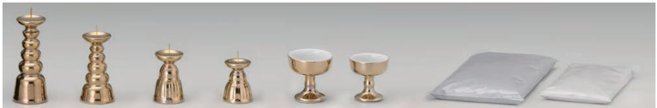
No.700-078 本金 40 ロウソク立 H11.5cm