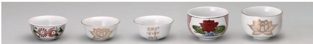
No.700-043 No.700-044 No.700-045 No.700-047 No.700-048 錦小出し 白金蓮小出し 御神前小出し 錦 2.4 紋輪 白金蓮 2.4 紋輪 7.0 × H3.5cm 7.0 × H3.5cm 7.0 × H3.5cm 7.5 × H5.0cm 7.5 × H5.0cm