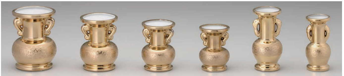
No.700-001 No.700-002 No.700-003 No.700-004 No.700-005 No.700-006 金唐草 5.0 玉仏花 11.0 × H14.3cm 金唐草 4.5 玉仏花 9.5 × H13.0cm 金唐草 4.0 玉仏花 8.5 × H11.5cm 金唐草 3.5 玉仏花 7.5 × H10.5cm 金唐草 6.0 並仏花 7.0 × H15.2cm 金唐草 5.0 並仏花 6.0 × H13.2cm