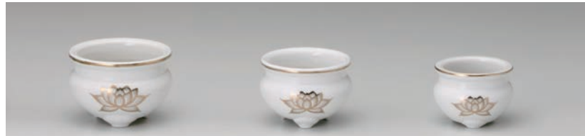
No.700-096 白金蓮 4.0 香炉 11.5 × H8.0cm