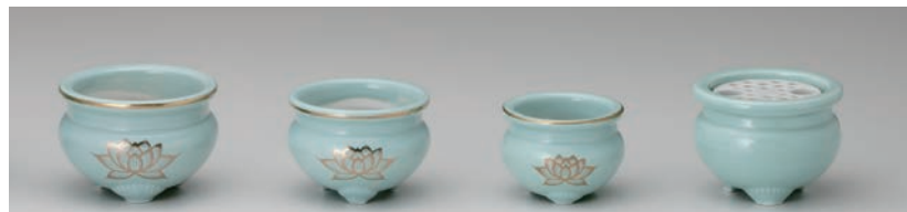
No.700-101 青磁金蓮 4.0 香炉 11.5 × H8.0cm