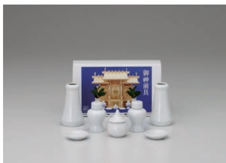
No.700-167 神具セット (ミニ) セット内容/白 30 横立×2, 白 20 瓶子×2, 白 12 水玉×1, 白 18 ナリ皿×2