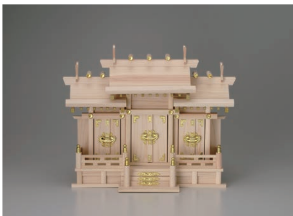
No.700-162 神棚 屋根違い三社 (小) 材質/檜 54.0 × 23.0 × H42.0cm