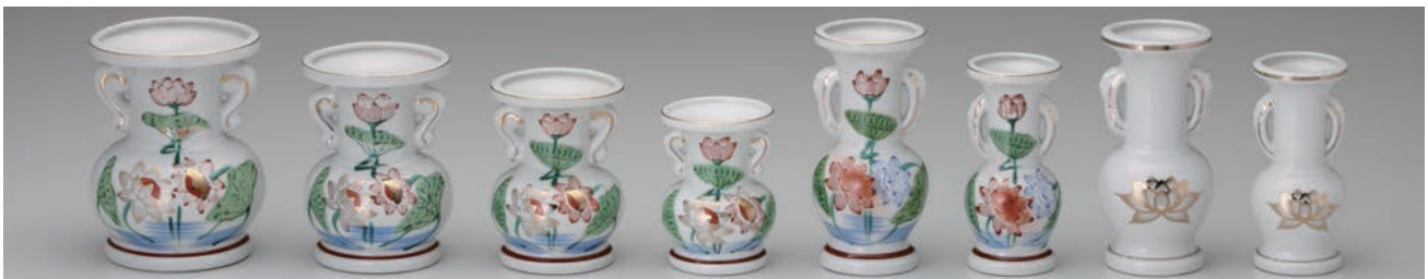
No.700-051 No.700-052 No.700-053 No.700-054 No.700-055 No.700-056 No.700-057 No.700-058 錦 5.0 玉仏花 錦 4.5 玉仏花 錦 4.0 玉仏花 錦 3.5 玉仏花 錦 6.0 並仏花 錦 5.0 並仏花 白金蓮 6.0 並仏花 白金蓮 5.0 並仏花 11.0 × H14.3cm 9.5 × H13.0cm 8.5 × H11.5cm 7.3 × H10.0cm 7.0 × H15.2cm 6.0 × H13.2cm 7.0 × H15.2cm 6.0 × H13.2cm