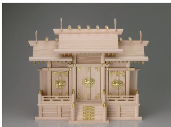
No.700-161 神棚 屋根違い三社 (中) 材質/檜 63.0 × 25.5 × H50.0cm