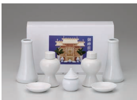
No.700-164 神具セット (大) セット内容/白 50 横立×2, 白 40 瓶子×2, 白 20 水玉×1, 白 30 ナリ皿×2