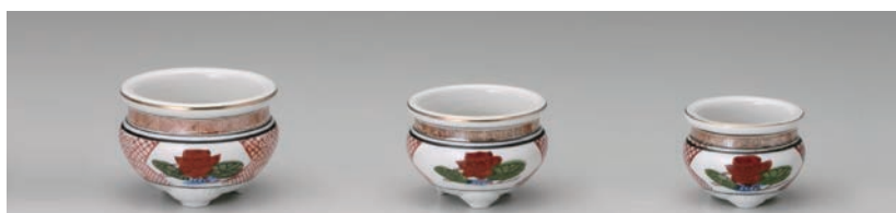
No.700-091 錦 4.0 香炉 11.5 × H8.0cm