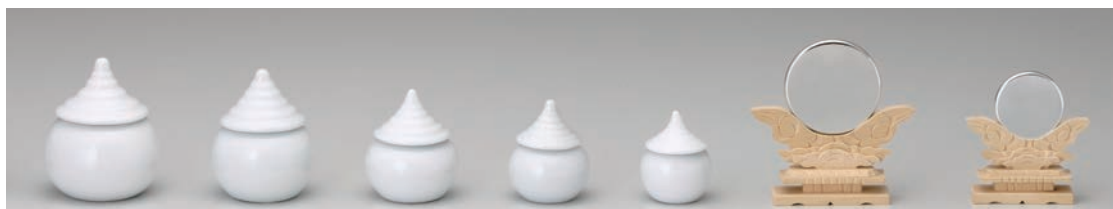
No.700-143 No.700-144 No.700-145 No.700-146 No.700-147 No.700-148 No.700-149 白 2.5 水玉 白 2.0 水玉 白 1.8 水玉 白 1.5 水玉 白 1.2 水玉 神鏡 2.0 木製台 (鏡/プラスチック) 神鏡 1.5 木製台 (鏡/プラスチック) 7.4 × H8.8cm 6.5 × H8.2cm 6.0 × H7.2cm 5.0 × H6.3cm 4.5 × H6.0cm H10.0cm H8.0cm