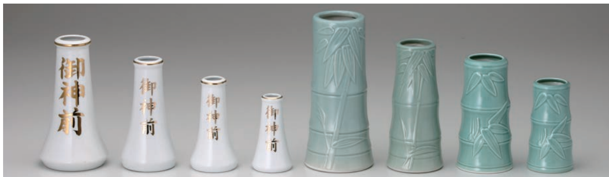
No.700-120 No.700-121 No.700-122 No.700-123 No.700-124 No.700-125 No.700-126 No.700-127 御神前 6.0 榊立 御神前 5.0 榊立 御神前 4.0 榊立 御神前 3.5 榊立 青磁 7.0 榊立 青磁 6.0 榊立 青磁 5.0 榊立 青磁 4.0 榊立 H18.5cm H15.5cm H12.8cm H10.5cm H21.5cm H18.0cm H15.7cm H12.4cm