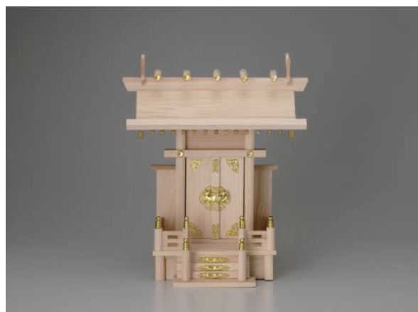
No.700-163 神棚 一社大神明 材質/檜 39.0 × 21.0 × H44.0cm