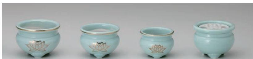
No.700-101 青磁金蓮 4.0 香炉 11.5 × H8.0cm