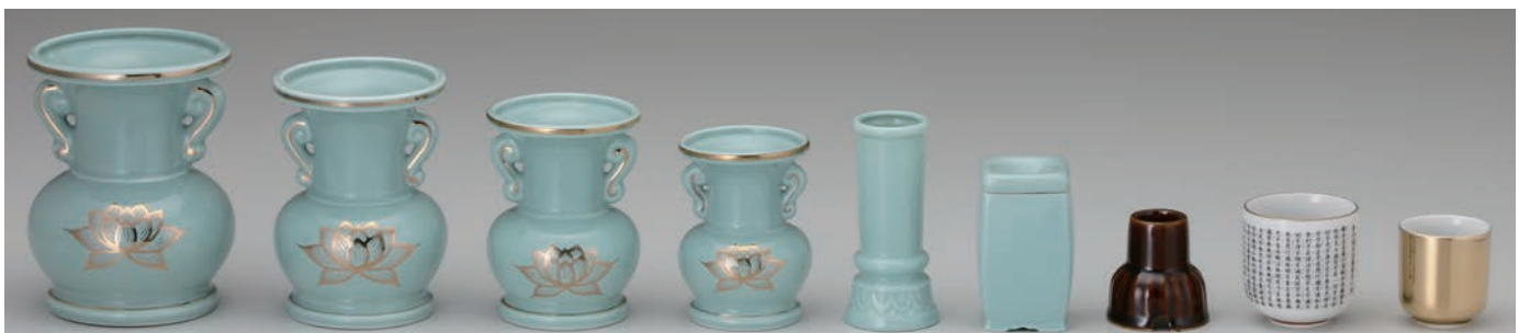
No.700-066 No.700-067 No.700-068 No.700-069 No.700-070 No.700-071 No.700-072 No.700-073 No.700-074 青磁金蓮 5.0 玉仏花 青磁金蓮 4.5 玉仏花 青磁金蓮 4.0 玉仏花 青磁金蓮 3.5 玉仏花 青磁線香差 青磁マッチ消し 茶墓用線香立 般若心経 2.0 湯呑 本金 1.6 湯呑 11.0 × H14.3cm 9.5 × H13.0cm 8.5 × H11.5cm 7.3 × H10.0cm 5.0 × H11.0cm 5.2 × 5.2 × H8.7cm 5.8 × H6.0cm 6.3 × H6.5cm 5.0 × H5.5cm