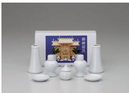
No.700-166 神具セット (小) セット内容/白 35 横立×2, 白 25 瓶子×2, 白 15 水玉×1, 白 20 ナリ皿×2