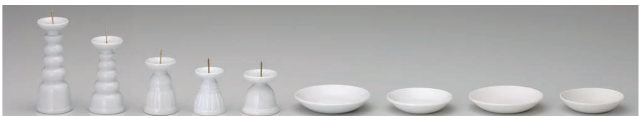
No.700-150 No.700-151 No.700-153 No.700-154 No.700-155 No.700-156 No.700-157 No.700-158 No.700-159 白 4.0 ロウソク立 白 3.0 ロウソク立 白 2.0 ロウソク立 白 1.5 ロウソク立 白だるまロウソク立 白 3.0 ヌリ皿 白 2.5 ヌリ皿 カワラケ (無軸) 3.0 皿 カワラケ (無軸) 2.5 皿 H11.5cm H9.0cm H6.5cm H5.5cm H4.8cm 9.3cm 7.8cm 9.3cm 7.8cm