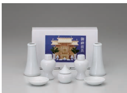
No.700-165 神具セット (中) セット内容/白 40 横立×2, 白 30 瓶子×2, 白 18 水玉×1, 白 25 ナリ皿×2