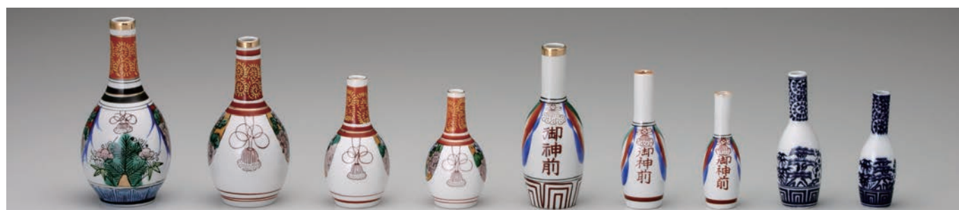
No.700-111 錦 6.0 玉神酒 8.5 × H17.5cm