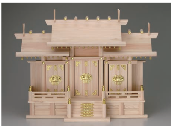
No.700-160 神棚 屋根違い三社 (大) 材質/檜 74.0 × 27.0 × H54.0cm