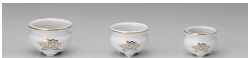
No.700-096 白金蓮 4.0 香炉 11.5 × H8.0cm