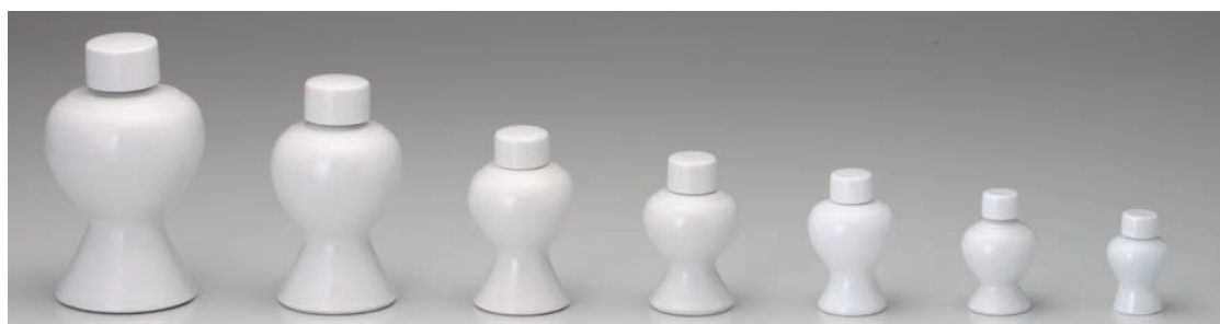
No.700-135 No.700-136 No.700-137 No.700-138 No.700-139 No.700-140 No.700-141 白 6.0 瓶子 白 5.0 瓶子 白 4.0 瓶子 白 3.5 瓶子 白 3.0 瓶子 白 2.5 瓶子 白 2.0 瓶子 H19.0cm H16.0cm H12.5cm H10.7cm H9.8cm H8.2cm H6.7cm