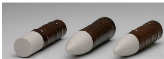
No.700-084 野花立竹型平底 (中) 5.2 × H23.0cm