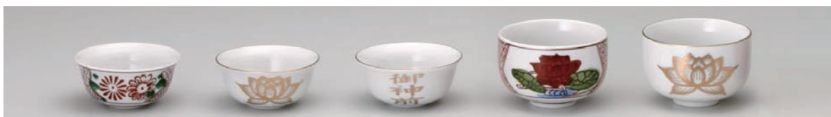
No.700-043 No.700-044 No.700-045 No.700-047 No.700-048 錦小出し 白金蓮小出し 御神前小出し 錦 2.4 紋輪 白金蓮 2.4 紋輪 7.0 × H3.5cm 7.0 × H3.5cm 7.0 × H3.5cm 7.5 × H5.0cm 7.5 × H5.0cm