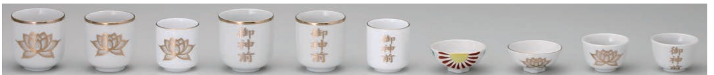
No.700-033 No.700-034 No.700-035 No.700-036 No.700-037 No.700-038 No.700-039 No.700-040 No.700-041 No.700-042 白金蓮 2.0 湯呑 白金蓮 1.8 湯呑 白金蓮 1.6 湯呑 御神前 2.0 湯呑 御神前 1.8 湯呑 御神前 1.6 湯呑 錦角浜 白金蓮角浜 白金蓮大深 御神前大深 6.2 × H6.3cm 5.8 × H6.2cm 5.0 × H5.5cm 6.2 × H6.3cm 5.8 × H6.2cm 5.0 × H5.5cm 6.2 × H3.0cm 6.2 × H3.0cm 5.5 × H3.7cm 5.5 × H3.7cm