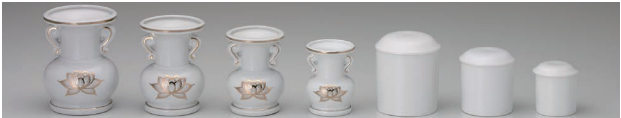
No.700-059 No.700-060 No.700-061 No.700-062 No.700-063 No.700-064 No.700-065 白金蓮 5.0 玉仏 白金蓮 4.5 玉仏花 白金蓮 4.0 玉仏花 白金蓮 3.5 玉仏花 白 3.0 骨壺 白 2.5 骨壺 白 2.0 骨壺 11.0 × H14.3cm 9.5 × H13.0cm 8.5 × H11.5cm 7.3 × H10.0cm 9.0 × H11.0cm 7.5 × H9.0cm 6.0 × H7.3cm