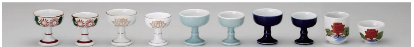
No.700-022 No.700-023 No.700-024 No.700-025 No.700-026 No.700-027 No.700-028 No.700-029 No.700-031 No.700-032 錦大仏器 錦中仏器 白金蓮大仏器 白金蓮中仏器 青磁大仏器 青磁中仏器 ルリ大仏器 ルリ中仏器 錦 1.6 湯呑 錦大深 5.8 × H6.3cm 5.2 × H5.7cm 5.8 × H6.3cm 5.2 × H5.7cm 5.8 × H6.3cm 5.2 × H5.7cm 5.8 × H6.3cm 5.2 × H5.7cm 5.0 × H5.5cm 5.5 × H3.7cm