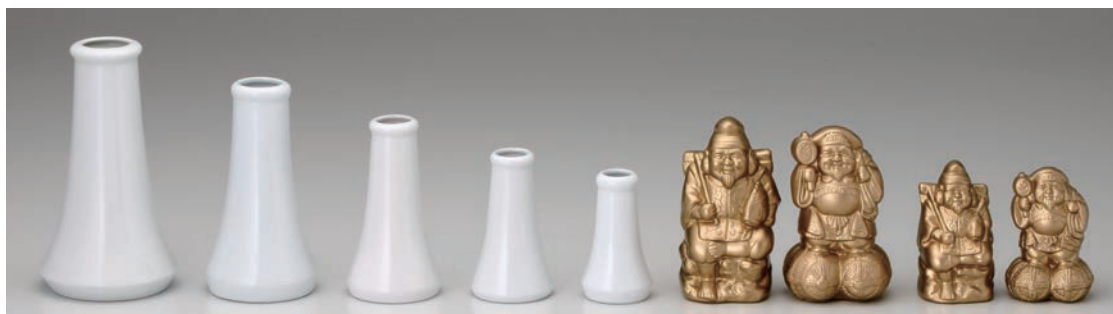
No.700-128 No.700-129 No.700-130 No.700-131 No.700-132 No.700-133 No.700-134 白 6.0 榊立 白 5.0 榊立 白 4.0 榊立 白 3.5 榊立 白 3.0 榊立 二福神恵比寿大黒 5.0 二福神恵比寿大黒 3.0 H18.5cm H15.5cm H12.8cm H10.50cm H9.4cm H13.5cm H10.0cm